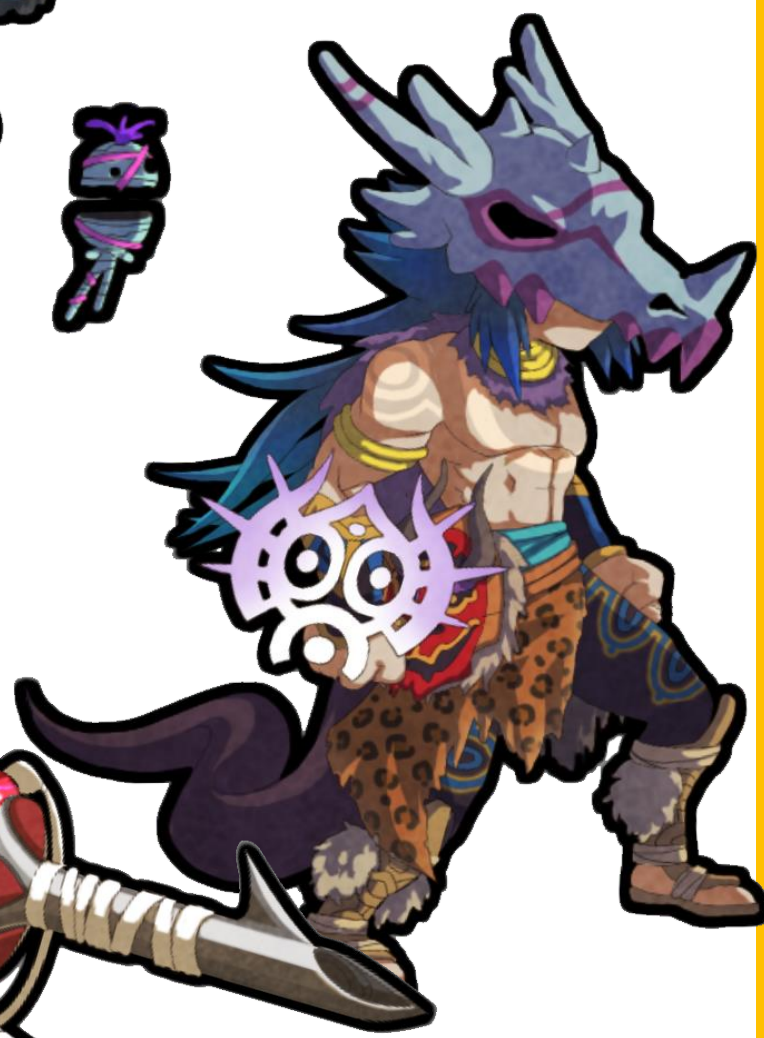
↑新規王ユニット(闇/杖)