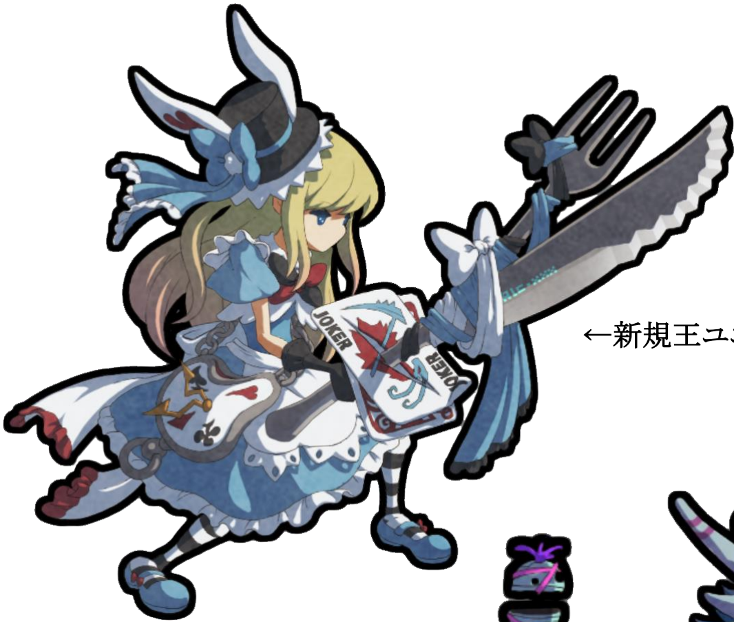
←新規王ユニット(水/剣)

■Ver.1.2.0では、様々な新ユニットが登場！ここでは、追加される王ユニットの一部をご紹介します。