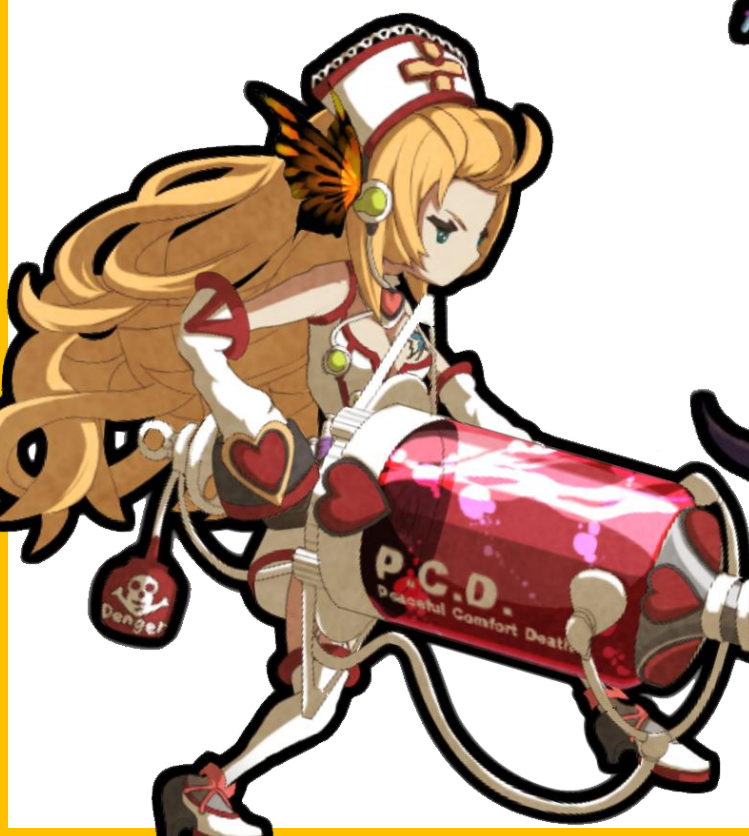
↓新規王ユニット(光/槍)